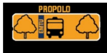
Figura 2 - ProPolos - EMTU