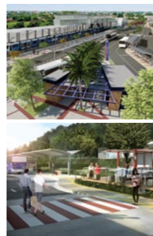
Figura 5 - Nas imagens a perspectiva do ProPolos em Franco da Rocha e em Itapeverica da Serra