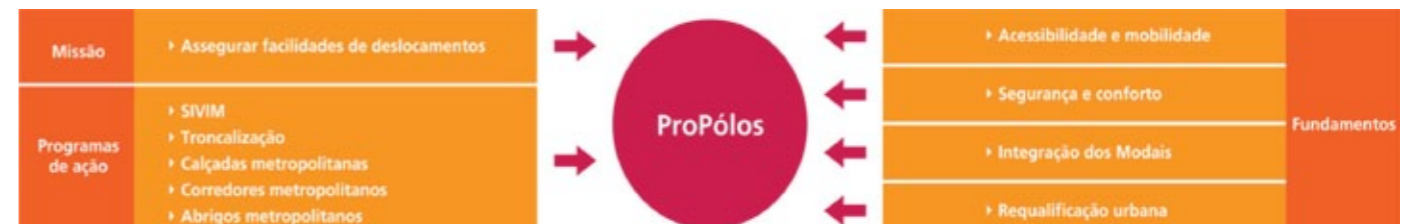
Figura 3 - Fundamentos do Programa ProPolos