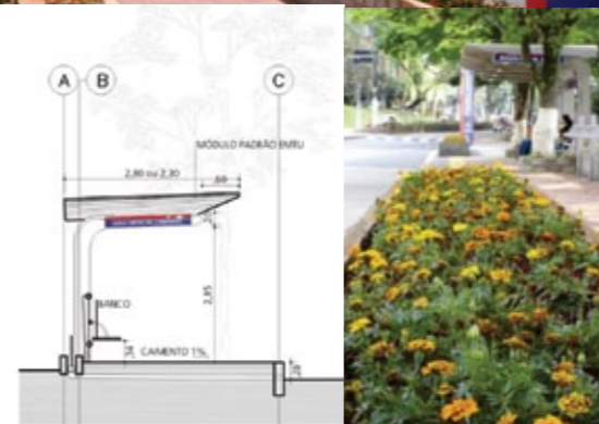
Figura 4 - ProPolos Caieiras