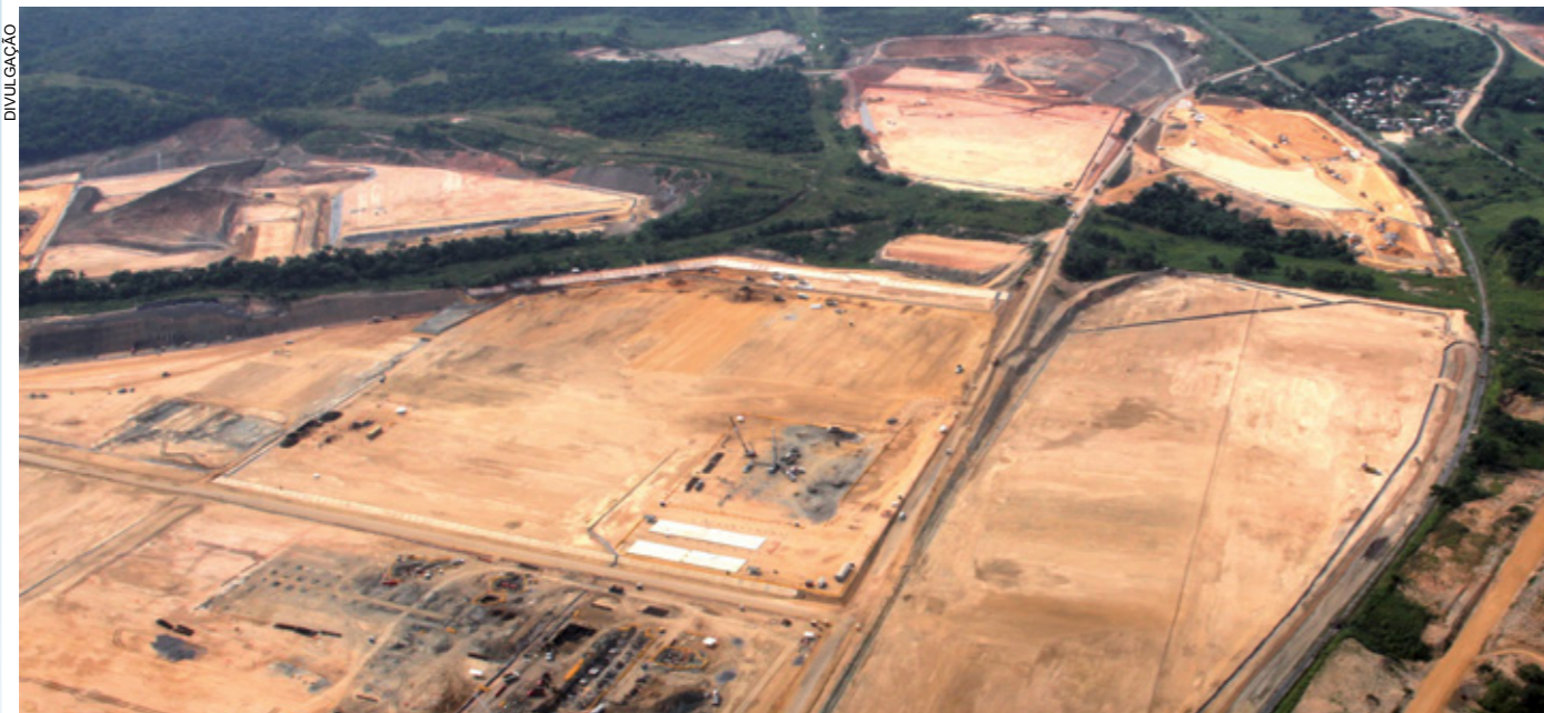
Vista aérea do início da implantação do empreendimento - Petroquímica Etileno XXI