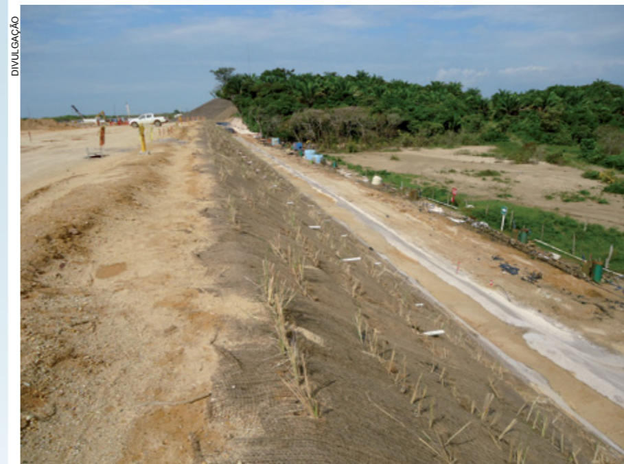
Borda da plataforma do Cracker, mostrando proteção de talude contra erosão e bombas de vácuo (em verde) no nível inferior

Este local apresentou desafios inéditos para a solução empregada, como a necessidade de implantar e iniciar a operação dos drenos a vácuo em prazo inferior a dois meses, a necessidade de acelerar os recalques para que ocorressem atendendo ao cronograma da fase de construção, à necessidade de se terem recalques de longo prazo de pequena magnitude, e à necessidade de se ter uma plataforma estável suportando fundações diretas de até 4 metros quadrados de área, com recalque inferior a 25mm. Tudo isto requereu a implantação,