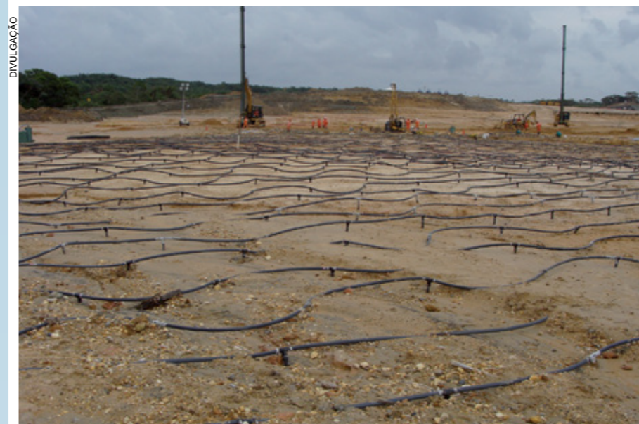
Cravação de drenos e tubulação para aplicação de vácuo para aceleração de recalques

Foi selecionada a solução de DVP, com aplicação de vácuo para aceleração dos recalques, por ser a alternativa mais rápida de execução (cada dreno era cravado e instalado em 10 minutos), mais econômica (cerca de cinco vezes mais barata que colunas de brita e dez vezes menos cara que Jet Grouting), atendendo aos requisitos de cronogra-